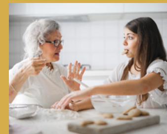
Generationen verbindend das passende Zuhause.