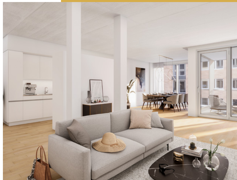
Wohnen heisst leben. Einziehen und wohlfühlen!