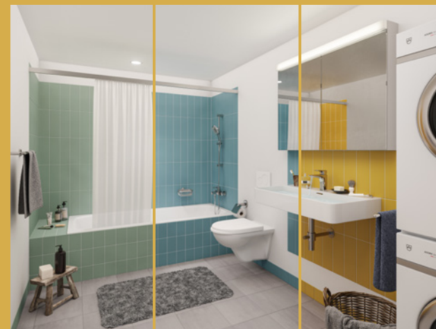
Schlichtschöne Bäder in drei Farbvarianten.