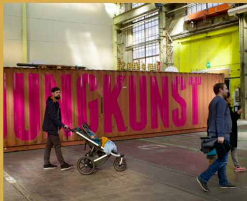
Mit Kunst und Kultur benachbart sein.