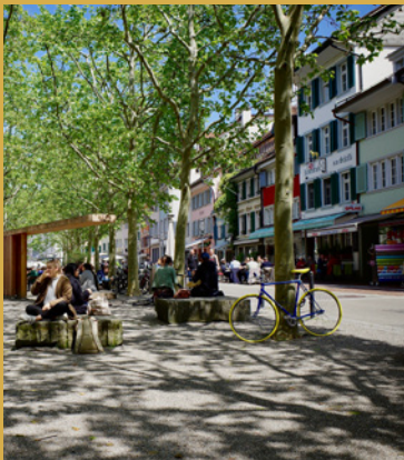
Mehr Leben – direkt vor der Haustür.