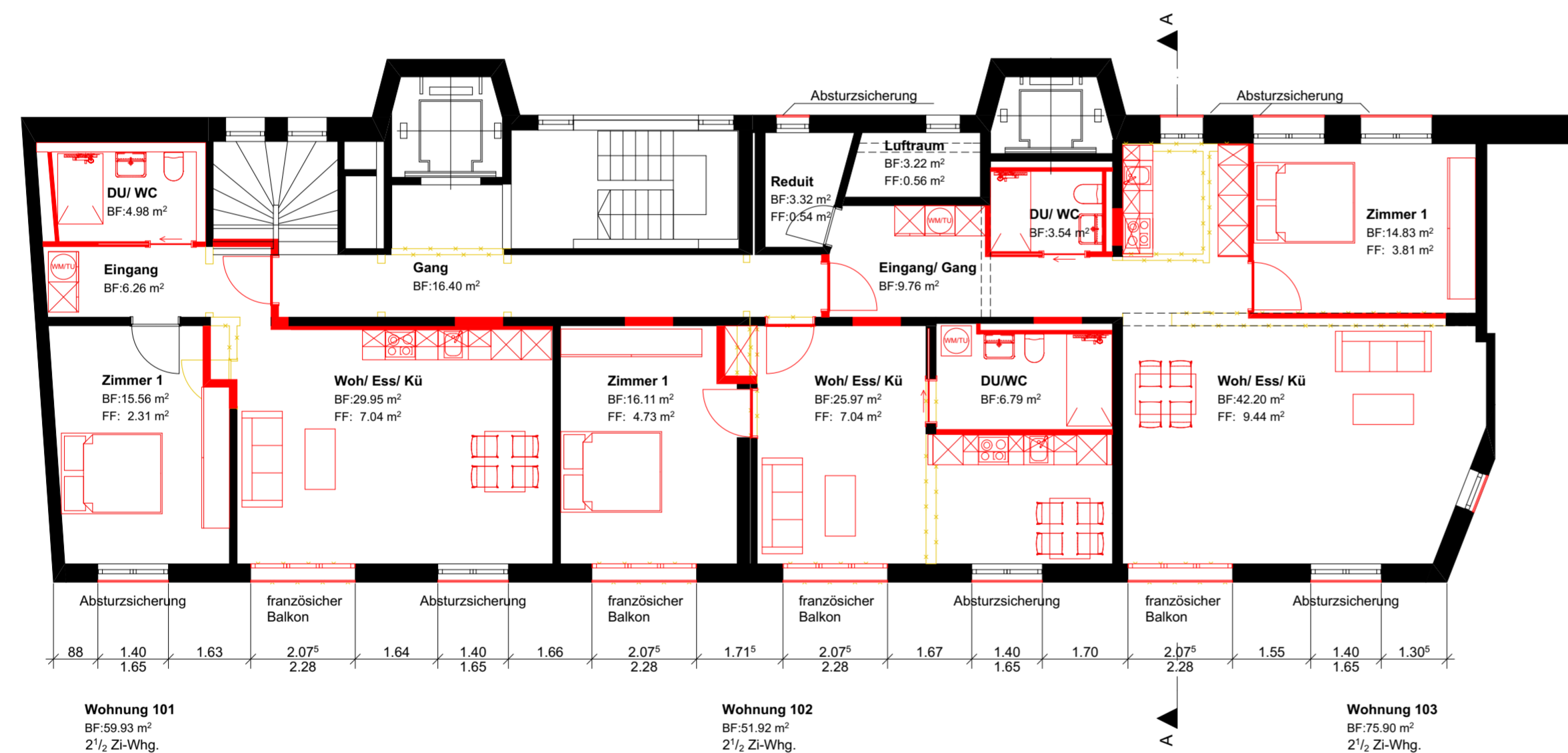
Grundriss 1. OG