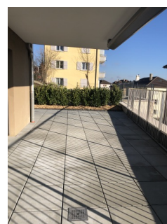
Balcon - terrasse